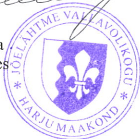
Allar-Reinhold Veelmaa vallavolikogu aseesimees

A handwritten signature in black ink, appearing to read 'Allar-Reinhold Veelmaa'.